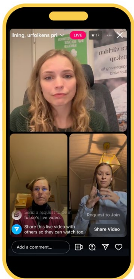
"Grön omställning, urfolks pris," ett av våra samtal som sändes live på Instagram fokuserade på intressekonflikterna mellan urfolks rättigheter och mineralerna som ska bygga den gröna omställningen.