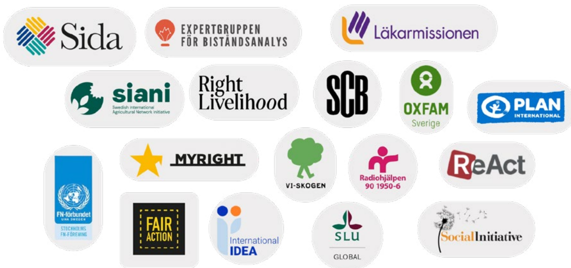
Mottagande praktikplatser under kalenderåret 2025.